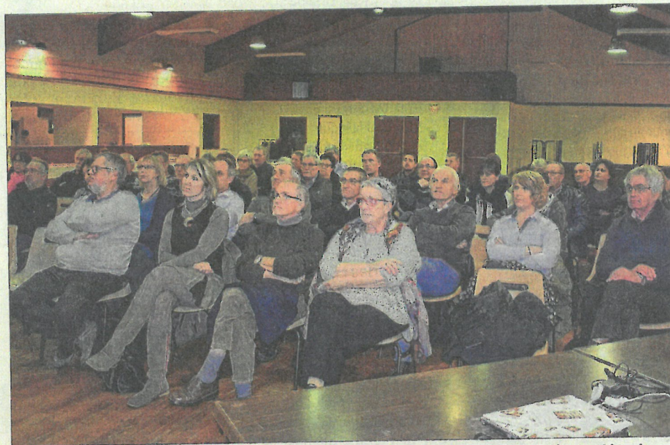
Les élus des 15 communes concernées par le projet de la nouvelle résidence Floréal ont découvert les plans dans les détails.